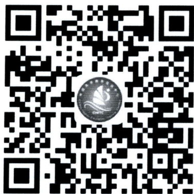
( 微信公众号 )

( https://chetc.cahe.edu.cn/ ) 或关注培训中心微信公众号了解更多培训动态。